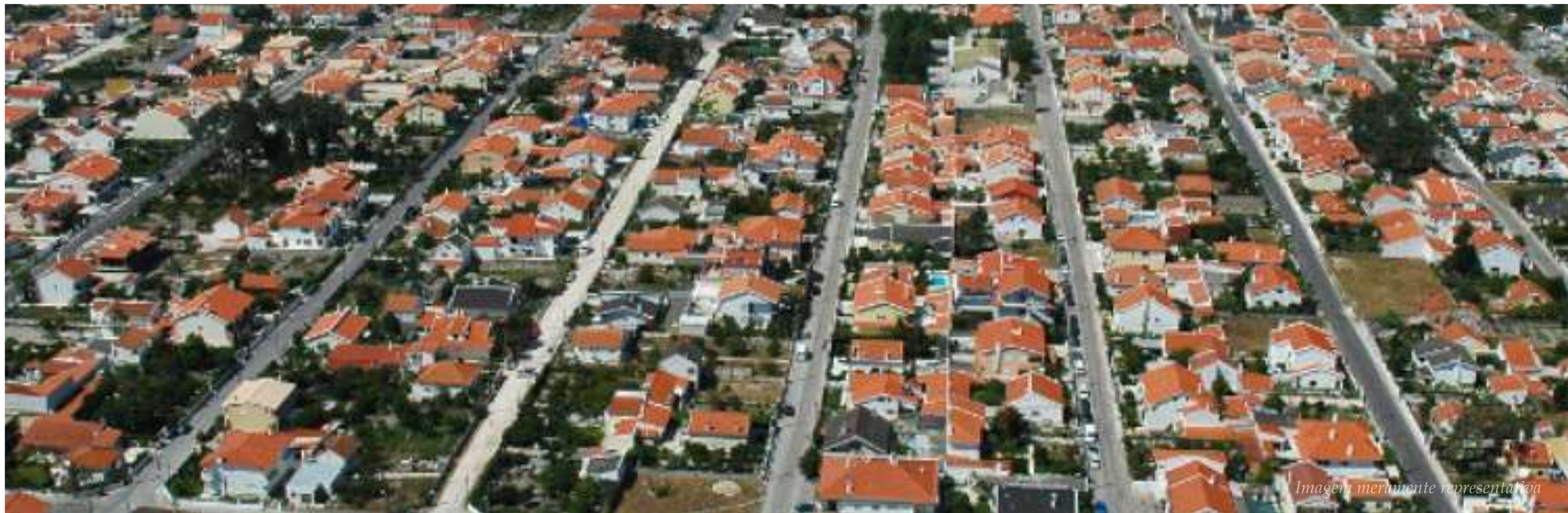
Imagem meramente representativa